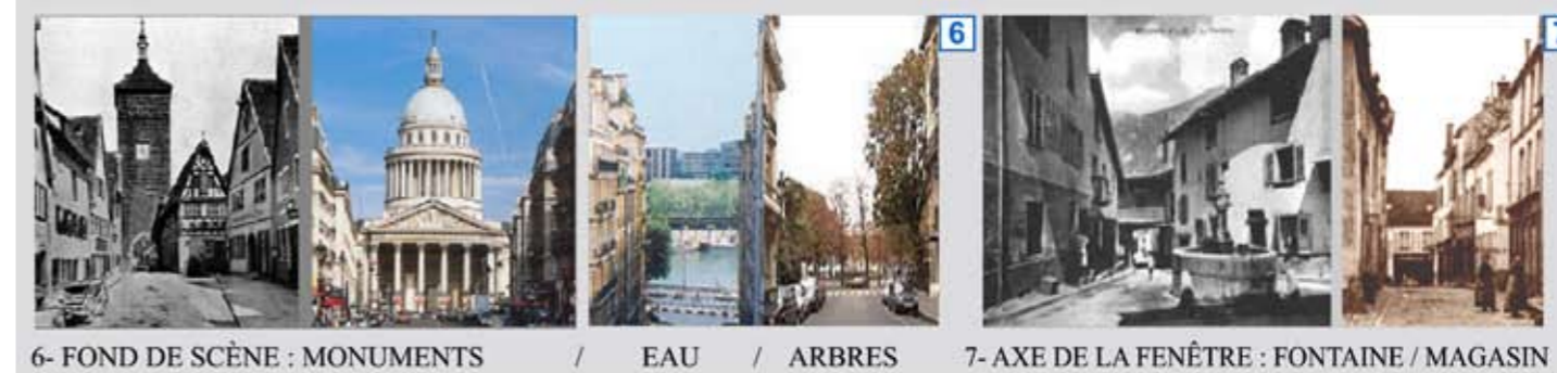
6- FOND DE SCÈNE : MONUMENTS / EAU / ARBRES