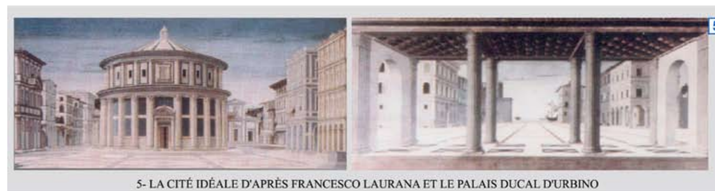
5- LA CITÉ IDÉALE D'APRÈS FRANCESCO LAURANA ET LE PALAIS DUCAL D'URBINO