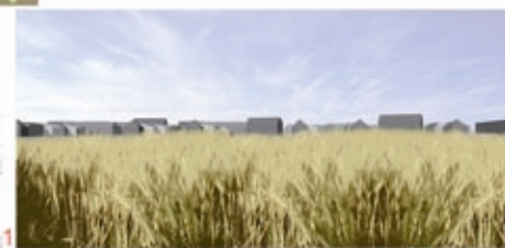
un horizon de ville à travers champs