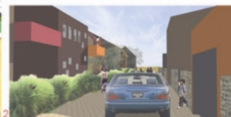
la rue comme lieu de vie