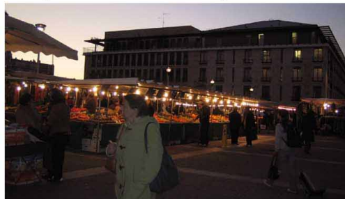
5. Régulièrement le parvis est plein de vie ...