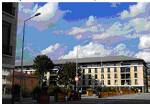
2. Un parvis aux bordures ouvertes.