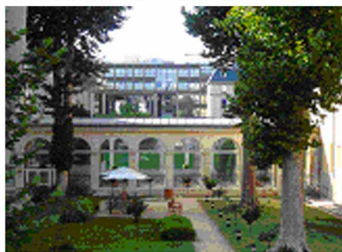
4. Le jardin en contre bas du parvis.