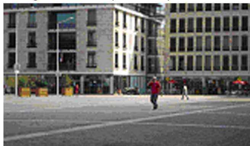
6. ...mais il reste souvent désert !