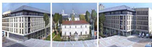
1. Depuis les balcons de l'hôpital