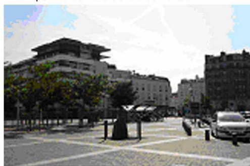
3. Un lieu de rencontre multi-modal