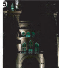
5 Essai de lumière