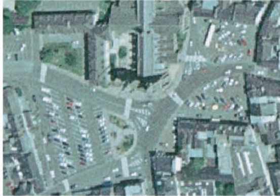
Avant : un vaste parking et un échangeur