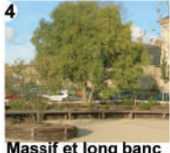
4 Massif et long banc