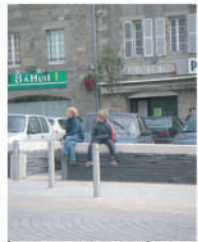
Les murets pratiques