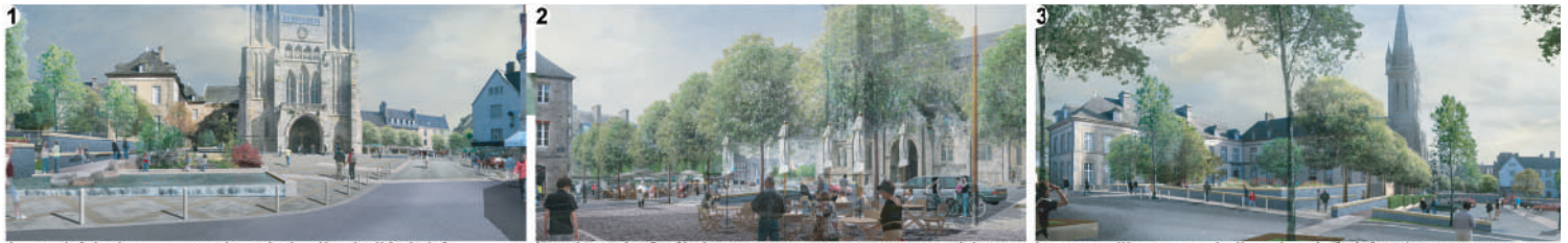
1 La cathédrale, son parvis et le jardin de l'évêché