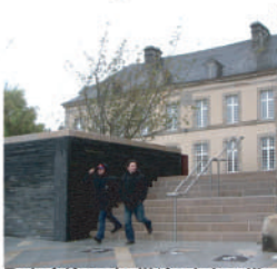
Belvédère de l'Hôtel de ville