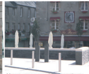
Une terrasse et les fontaines