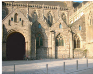
La naissance du parvis