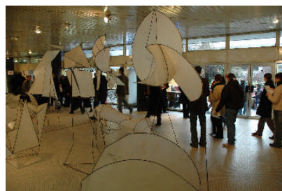
Hall d'accueil de l'école lors des portes Ouvertes 2005