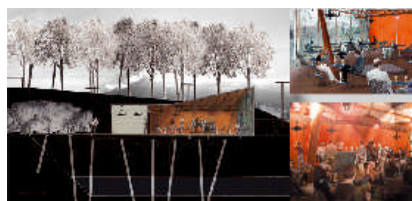
Salle de concert sur la Marne Projet Design Espace 2005