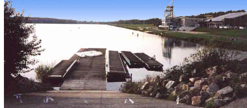
Mention "Qualité de l'environnement" au prix arturbain.fr 1999 " Site sportif de plein air et de loisirs de l'île de VAIRES SUR MARNE ",