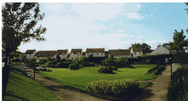
Sélectionné au " Prix arturbain.fr 1998 ", " Une friche transformée en 'cœur de ville' à Chevilly-Larue , Val de Marne.

Cette commune située à 5 km au sud de Paris, possédait sur son territoire, le long de la RN7, de vastes espaces occupés essentiellement par des casses de voitures. Suite au décret du 16 mai 1984 du Conseil Régional d'île de France ayant approuvé l'abandon du tracé nord de l'A86, tous ces espaces en friches dévalorisant le paysage ont dès lors constitué une opportunité foncière pour la finalisation de l'urbanisation du territoire.