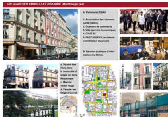
Mention qualité de la vie sociale et Meilleure communication au Prix arturbain.fr 2002 avec l'opération « Un quartier embelli et réanimé », Montrouge (92), Pact-Arim des Hauts de Seine