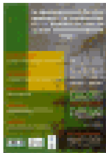
Organisation de conférences sur le développement durable