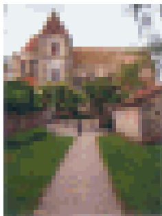
Journée du patrimoine à Champcueil