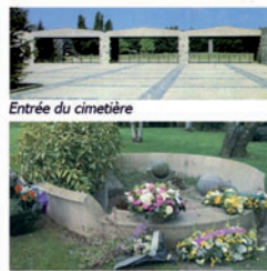
Entrée du cimetière