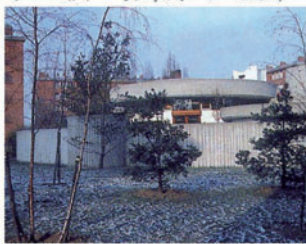
La Petite Bibliothèque Ronde (Atelier de Montrouge)