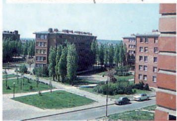
La Cité de la Plaine