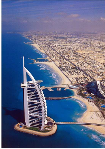
1 Burj el Arab