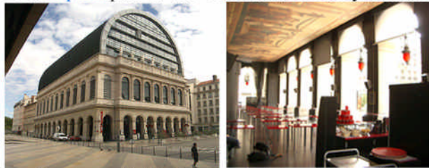
* ... et le Pignon de l'Opéra. Le péristyle est un lieu de rencontres et d'échange.