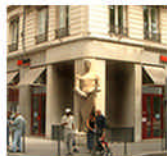
* Fréquemment, les angles de deux voies accueillent des sculptures (monuments aux morts, vierges). Ils sont traités en colonne, rotonde, pan coupé aveugle...