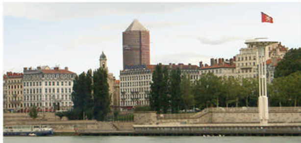
* Des repères pour la ville : la tour du Crédit Lyonnais...