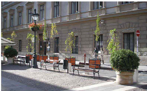
Aménagement et traitement de sol soigné Alignement d'échoppes, dans le centre-ville.