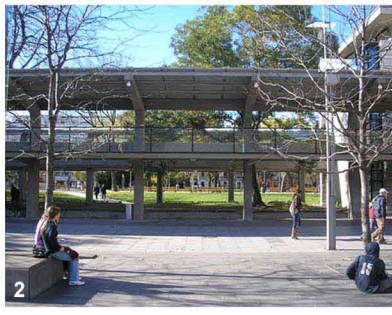
Lieux de rencontre et de détente pour les Hongrois dans le tissu urbain dense de la capitale.