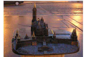
Maquette de ville représentant l'église St Mathias et le bastion des Pêcheurs, véritable belvédère sur le Danube.