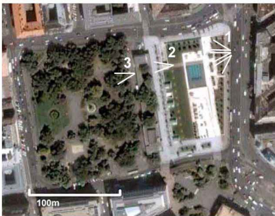
Séquence Linéaire sur les places Erzsébet Tér et Deak Tér :