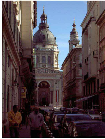
Fenêtre urbaine, avec l'Eglise Szaiztvan en fond de scène