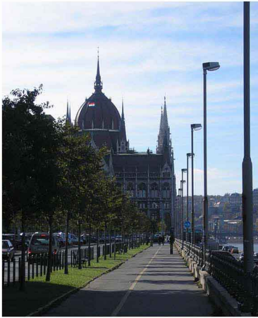
Le Parlement sur les bords du Danube, un repère pour la ville