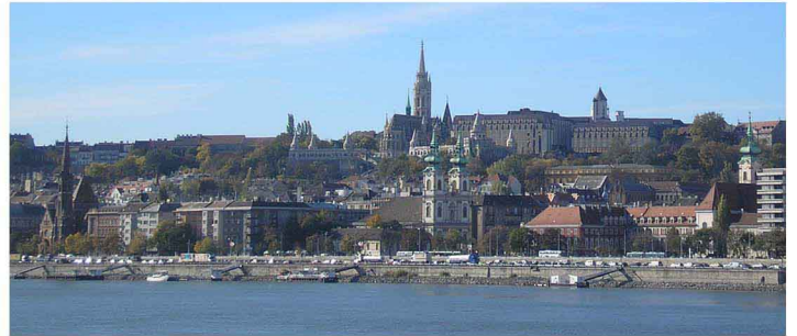
Silhouette de la colline de Buda et de ses églises