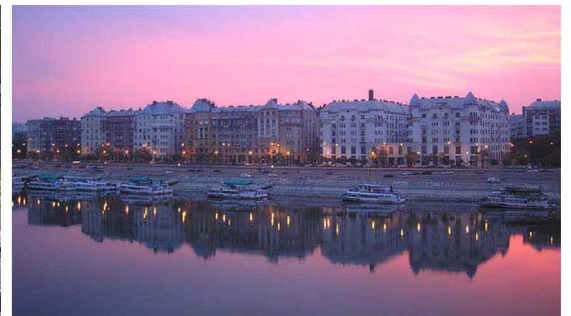
Front bâti et reflet des quais du Danube. Budapest depuis le parc de la colline Gellért