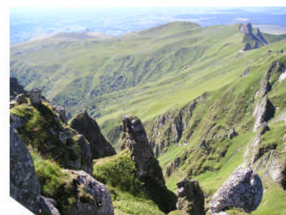
* Entre lacs, rivières et volcans, un patrimoine environnemental naturel à préserver