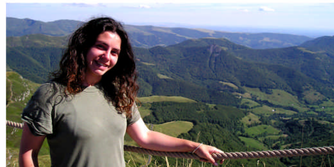
Vue sur les volcans depuis le sommet du Puy Mary.