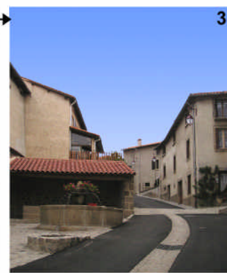
* Séquence linéaire : 1→2→3, au Monastier sur Gazeille, dans le centre-ville .