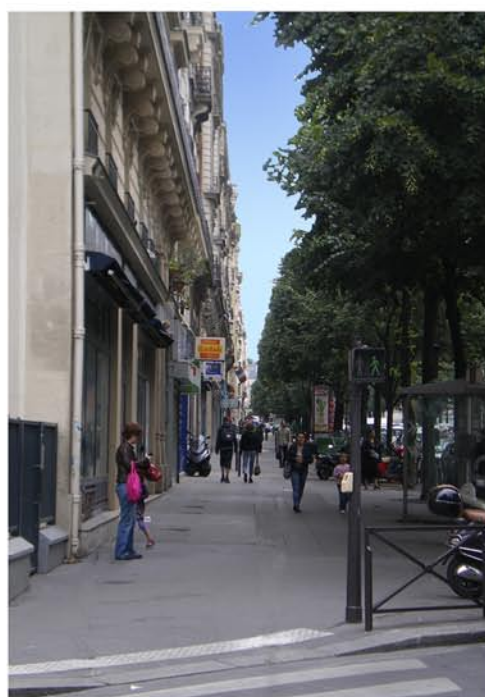
Trottoir et platanes d'alignement