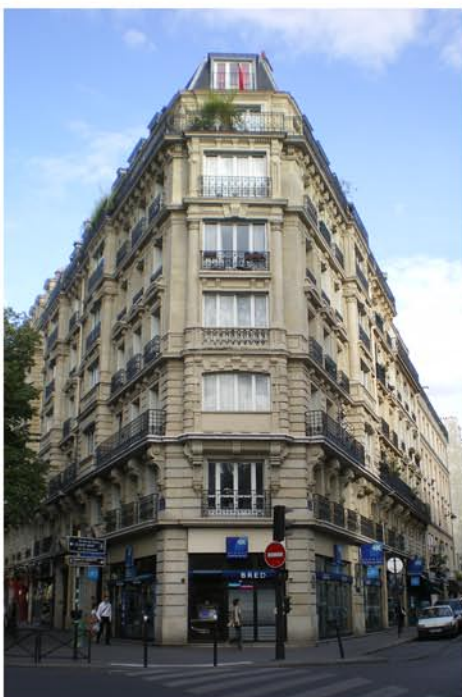
Angle de deux voies