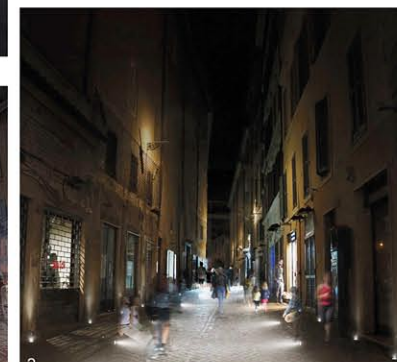
RESPECT DE L'ENVIRONNEMENT Meilleure efficacité de fonctionnement de la ville, par l'extension des horaires d'activité pour le public, qui amène du mouvement et des comportements productifs après la tombée de la nuit.