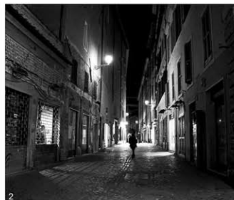
2 Couloirs de circulation piétonne désertés et sombres le long des grands axes de circulation.