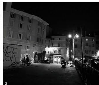
3 Espaces publics plongés dans l'obscurité, isolés au milieu d'un flot de véhicules.