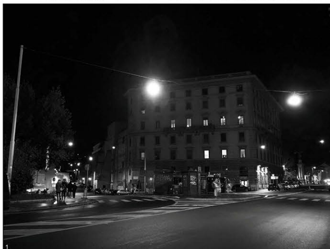
1 Terminus de bus isolés, mal éclairés, entourés de voies où la circulation est très dense.

La Boucle de lumière consiste en un réseau d'espaces publics illuminés, qui stimulent l'activité pendant la journée et dynamisent la vie nocturne. Un système d'éclairages stratégiques, positionnés à proximité immédiate des emplacements choisis et dans le contexte urbain environnant, permet de créer des lieux d'interaction et d'établir une unité des couloirs de circulations piétonnes. Le dispositif invite à exploiter des zones centrales de la ville, en les amenant au niveau de trépidante activité diurne qui fait le charme et la réputation des rues romaines.