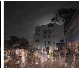
QUALITÉ ARCHITECTURALE Création d'un "esprit des lieux" séduisant, avec le remaniement des espaces ouverts et des couloirs de circulation piétonne par l'illumination de l'environnement existant.