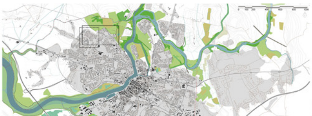
(Plan de territoire) Limerick, située à l'embouchure du Shannon à l'ouest de l'Irlande, est aujourd'hui une ville « donut ». Paradoxalement, le quartier étudié est sur le point d'être rasé, brisant une communauté.