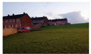
(Relevé) «Patron» de la maison individuelle caractéristique répétée sur tout le site : conçue pour 4 personnes, s'articulant entre un jardin d'apparat à l'avant, un jardin arrière en longueur, s'assemblant en bandes et îlots.