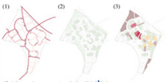
(Schémas des concepts génératifs) * (1) accès, hiérarchie des rues et parkings collectifs (2) les coeurs d'îlots ouverts collectifs : un nouveau type d'espace vert semi-privé commun (3) une diversité des espaces publics et collectifs traités dans leur contexte territorial et social (places publiques, jardins familiaux, communautaires,...)