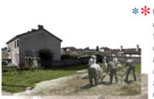
* * * COOPERATIVE DE CONSTRUCTION donner aux habitants l'opportunité de retravailler leurs maisons en leur apportant des connaissances techniques, matériaux, outils, un endroit pour expérimenter... créant ainsi une diversité du parc de logement, une possibilité d'accès à la propriété, une création d'emploi...