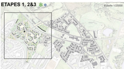
(Plan d'aménagement) Reconnecter par les routes/les espaces verts diversifiés et qualifiés/de nouveaux logements collectifs et commerces.