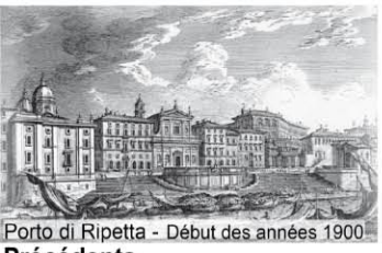
Précédents Intégration de la circulation des personnes et de l'eau