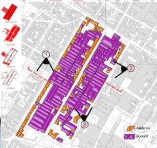
⊕ echelle de 1:2000

MACROLOTTO 0 est la première zone industrielle à Prato. Elle est caractérisée par une grande mixité aux marges et par une haute occupation du sol, aujourd'hui elle est surdimensionnée pour la production textile parcequ'elle a principalement la fonction de depot, choise du marchandise et service textile non productif. Il y a une haute pourcentage de population chinoise et aujourd'hui il n'est pas possible de soutenir les nouveaux exigenses pour l'installation. Sans les services elle est fermé dans un jeux de tesselle