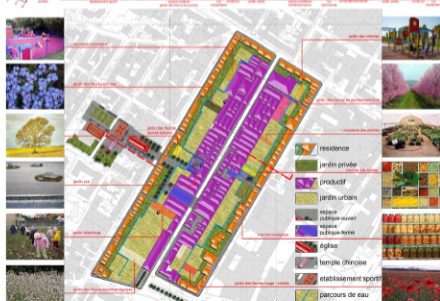
⊕ echelle de 1:2000