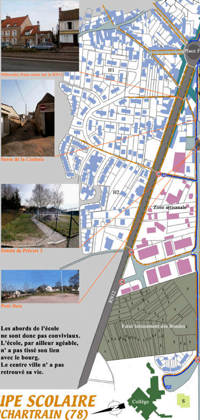
Débouché d'une sente sur la RN12