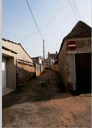
Sente de la Cimbale