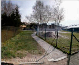
Entrée de Prévert 3