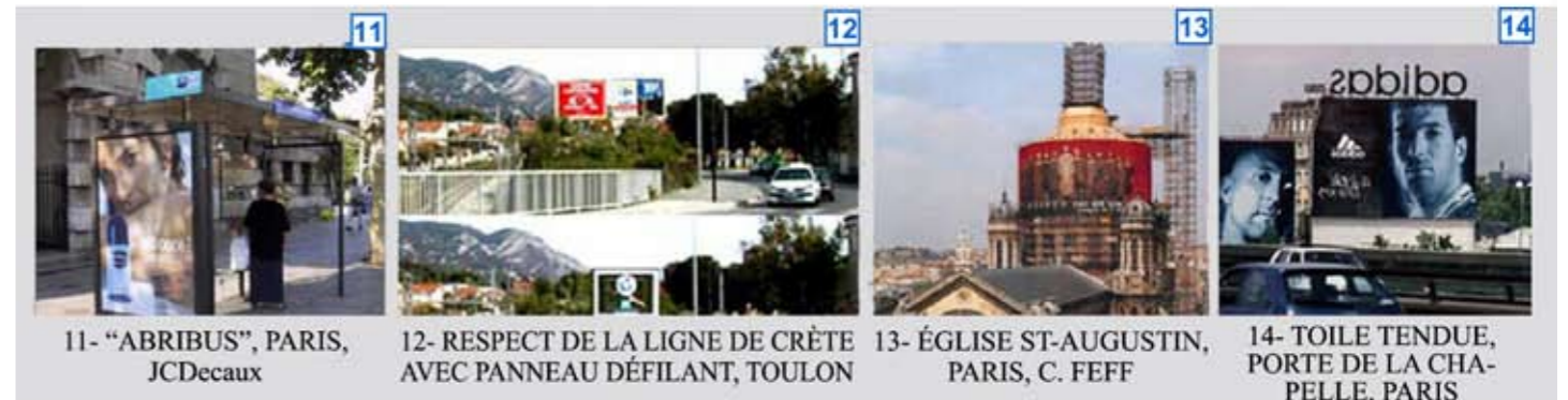
11- "ABRIBUS", PARIS, JCDecaux 12- RESPECT DE LA LIGNE DE CRÈTE AVEC PANNEAU DÉFILANT, TOULON 13- ÉGLISE ST-AUGUSTIN, PARIS, C. FEFF 14- TOILE TENDUE, PORTE DE LA CHAPPELLE, PARIS