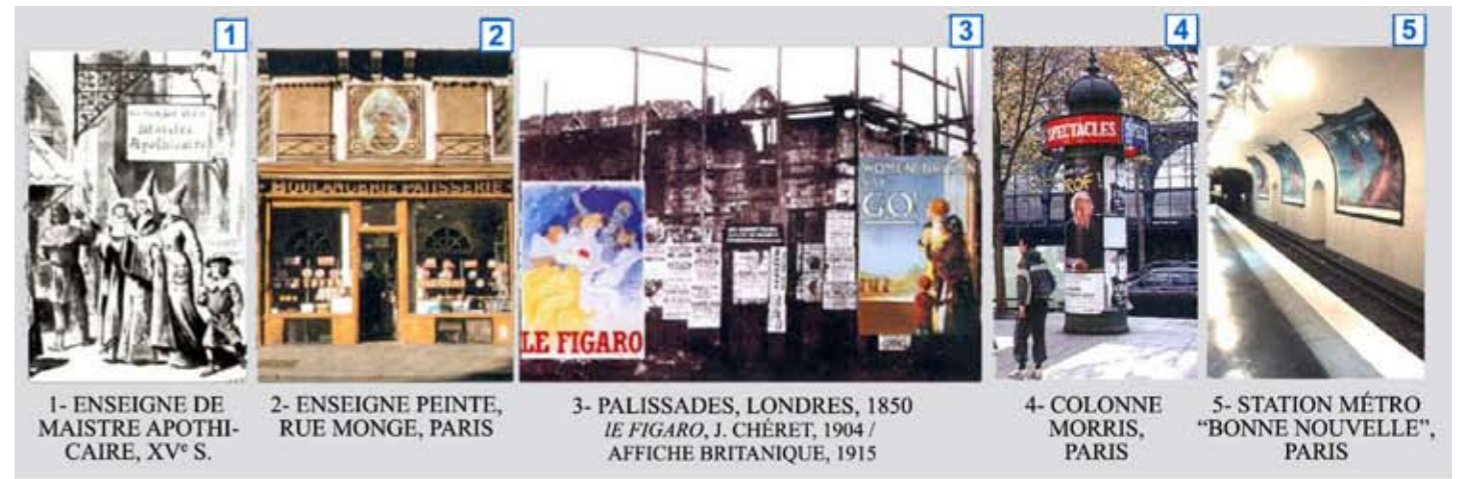
1- ENSEIGNE DE MAISTRE APOTICAIRE, XV e S. 2- ENSEIGNE PEINTE, RUE MONGE, PARIS 3- PALISSADES, LONDRES, 1850 LE FIGARO, J. CHÉRET, 1904 / AFFICHE BRITANIQUE, 1915 4- COLONNE MORRIS, PARIS 5- STATION MÉTRO "BONNE NOUVELLE", PARIS

V. AFFICHE D'ART, BANC PUBLIC, ÉCHAFAUDAGE, ENSEIGNE, MUR PEINT, MOBILIER URBAIN, PALISSADE, PANNEAU PORTATIF, PLAN LUMIÈRE, PRÉ-ENSEIGNE, PUBLICITÉ LUMINEUSE, SIGNALÉTIQUE URBAINE.