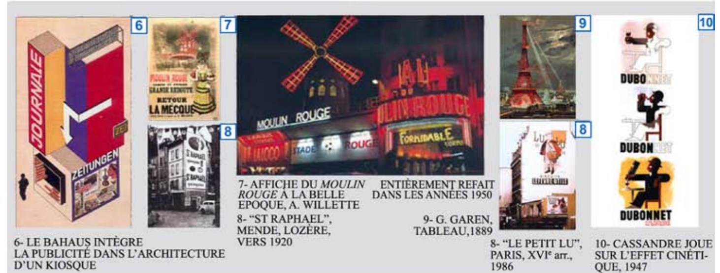
6- LE BAHAUSS INTÈGRE LA PUBLICITÉ DANS L'ARCHITECTURE D'UN KIOSQUE 7- AFFICHE DU MOULIN ROUGE À LA BELLE ÉPOQUE, A. WILLETTE 8- "ST RAPHAEL", MENDE, LOZÈRE, VERS 1920 9- G. GAREN, TABLEAU, 1889 10- CASSANDRE JOUE SUR L'EFFET CINÉTIQUE, 1947