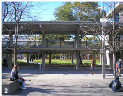
Lieux de rencontre et de détente pour les Hongrois dans le tissu urbain dense de la capitale.